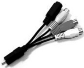
Figure 3-3 Câble audio/vidéo

Le mini-connecteur DIN du câble permet de connecter au port A/V situé sur le côté de votre ATI TV Wonder™ 600. Le câble A/V ne peut se connecter au port que d'une seule façon. Le câble est doté de connecteurs d'entrée composite standard et, pour une qualité améliorée (en cas de prise en charge par votre périphérique), d'un connecteur S-vidéo. Pour en savoir plus sur la connexion d'un périphérique externe au moyen d'un câble A/V, consultez le manuel de votre périphérique.