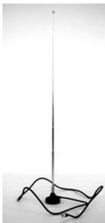
Figure 3–5 Antenne télescopique

attention à ne pas la placer à moins de 20 cm d'un disque ou d'une unité de stockage, d'une carte mémoire, d'une carte de crédit, ou de tout autre objet pouvant s'endommager en raison d'une proximité trop proche à un matériel magnétique. Sinon, vous risquez de perdre vos données.