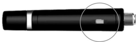
Figure 3–4 Vue de côté du ATI TV Wonder™ 600 avec port audio/vidéo